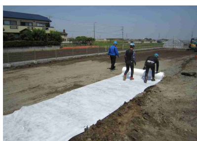
3. 吸出し防止材敷設