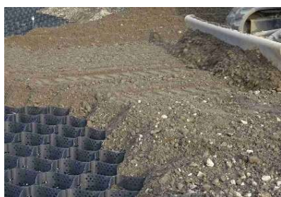
まき出し・転圧・敷き均し2