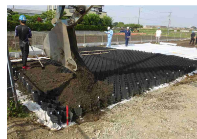
5. まき出し・転圧・敷き均し1