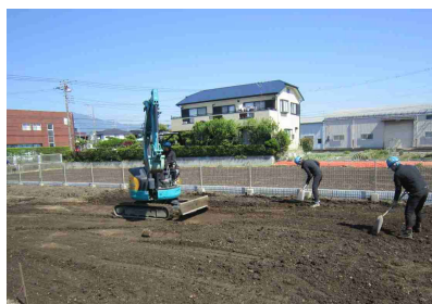
まき出し・転圧・敷き均し3