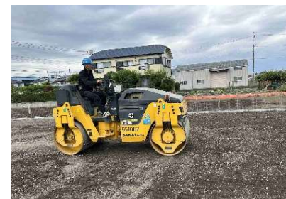
まき出し・転圧・敷き均し4